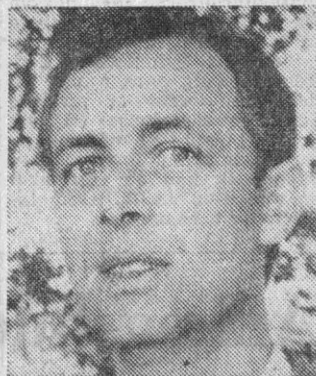
Ministeren vil gerne besøge Langeland igen