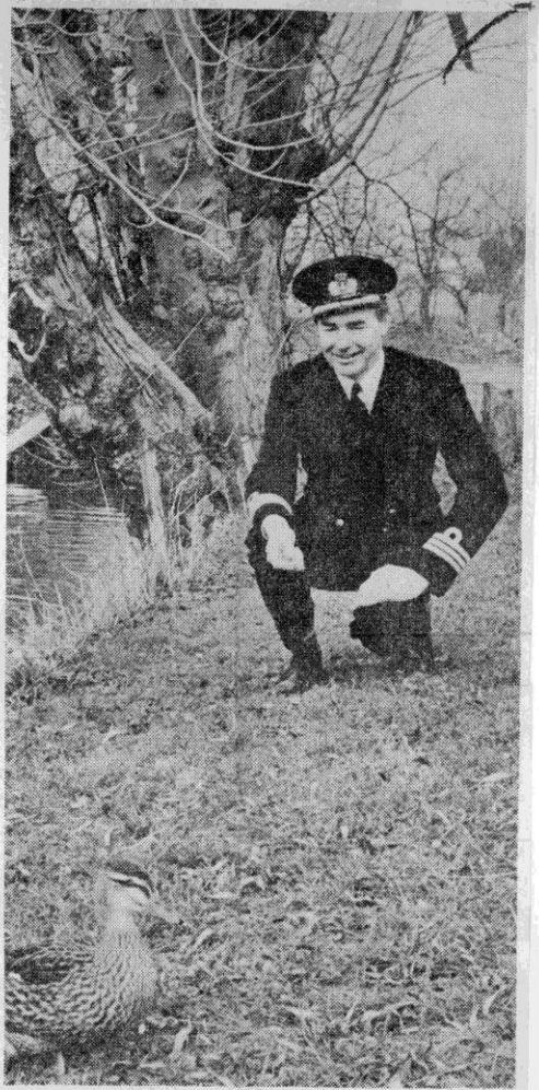
I fritiden er det landbruget, jagt og fiskeri, der interesserer. Her forsøger den nye næstkommanderende sig som lokkemænd.